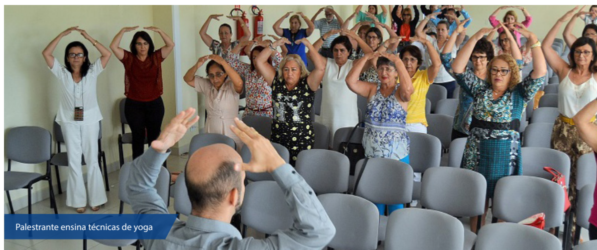
Palestrante ensina técnicas de yoga

Klinger trouxe pra prática o que foi apresentado em teo-