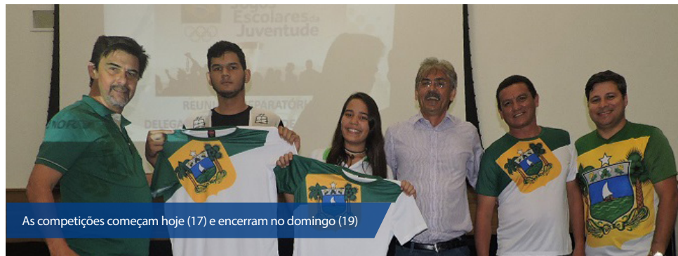
As competições começam hoje (17) e encerram no domingo (19)