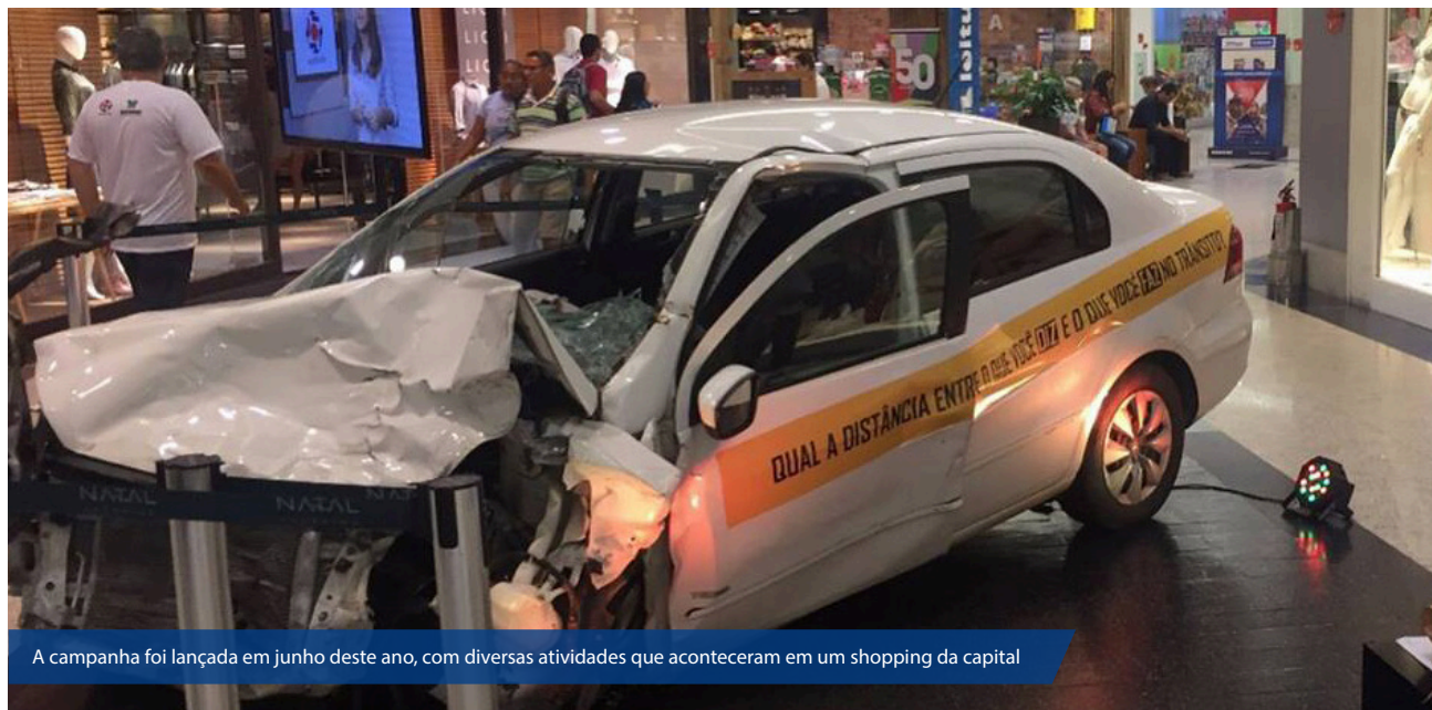
A campanha foi lançada em junho deste ano, com diversas atividades que aconteceram em um shopping da capital

O principal intuito da campanha é despertar a reflexão em cada um sobre o que se diz e o que se faz na posição de motorista no trânsito